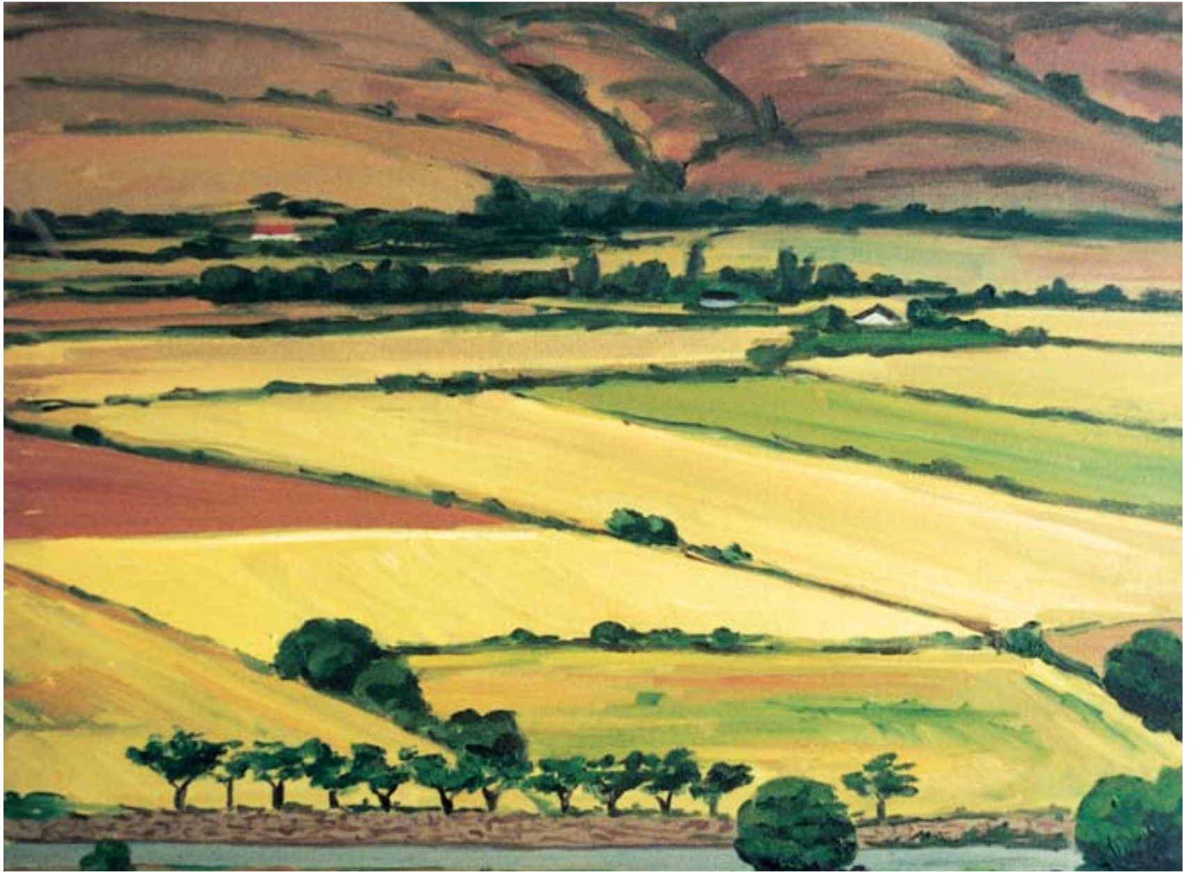
Carretera Adas. 1998. (50 x 65 cm). Oli sobre tela