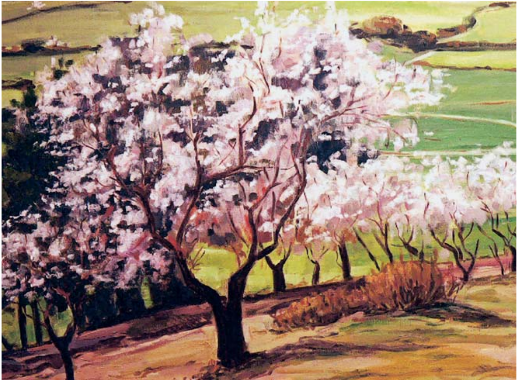
Ametllers florits. La Segarra. 2005 (73 x 95 cm)