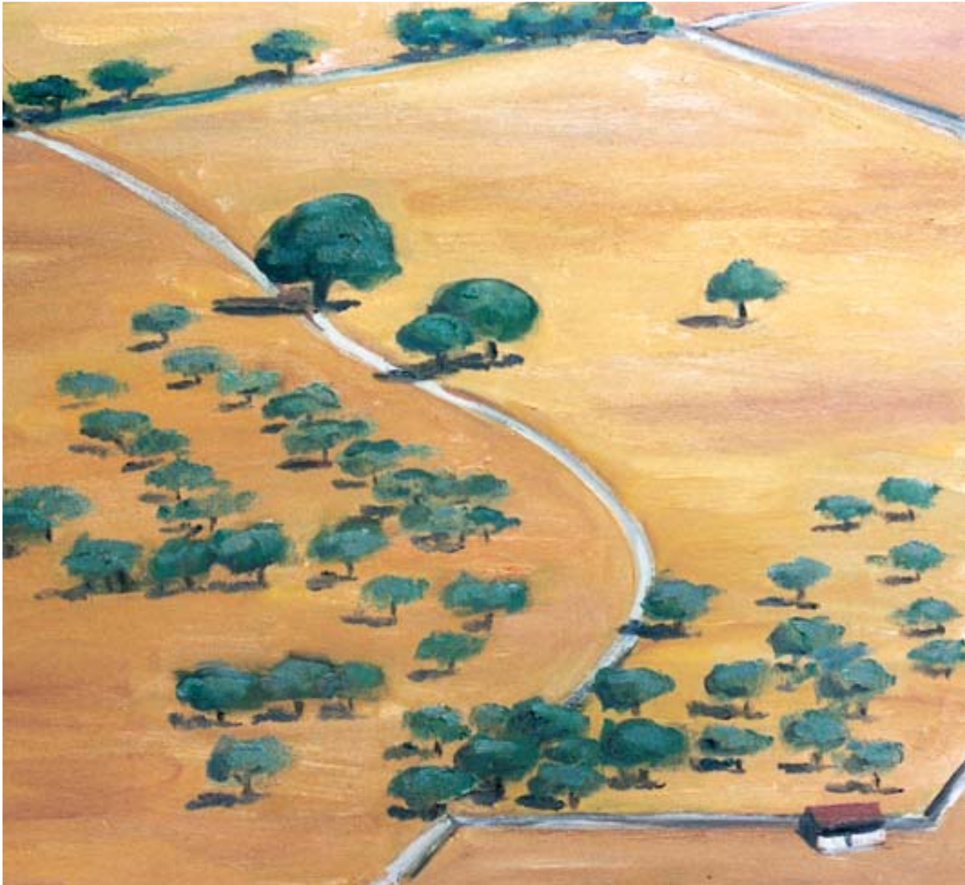
Pla d'Aubarca II. Mallorca. 2003 (46 x 55 cm). Oli sobre tela