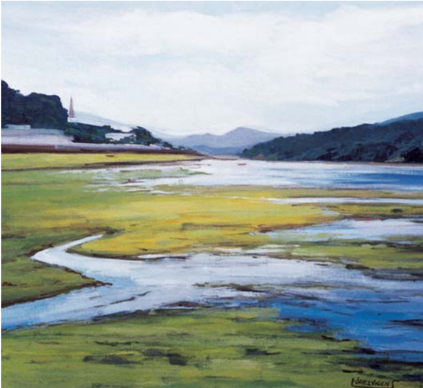
Marea baixa (Ortigueira). 2003. 73 x 92 cm. Oli sobre tela