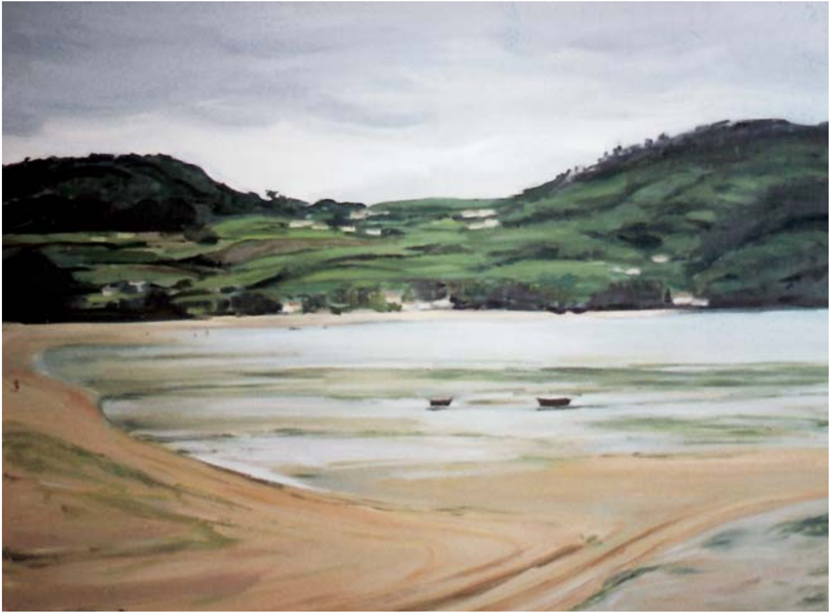
Dia gris (Cedeira). 2001. (89 x 116 cm). Oli sobre tela