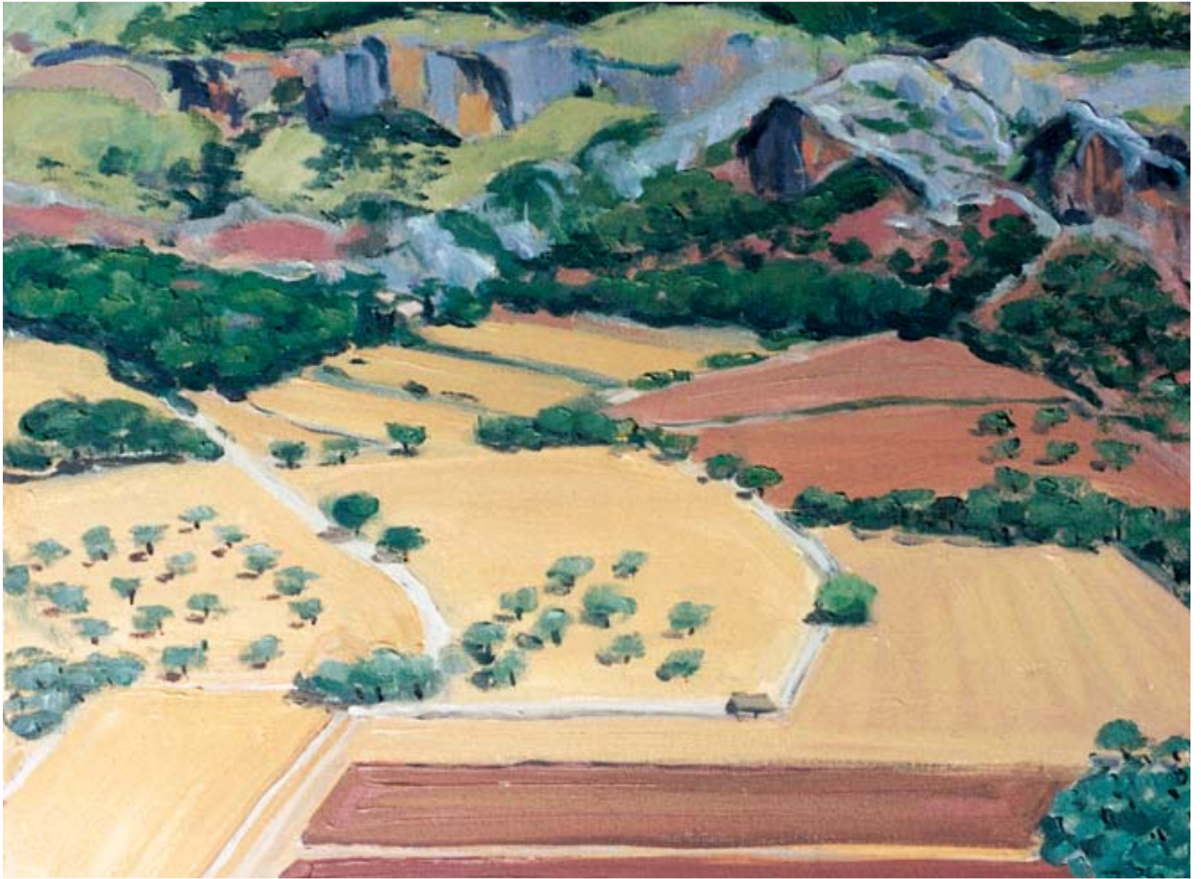
Pla d'Aubarca I. 2003. (46 x 55 cm)